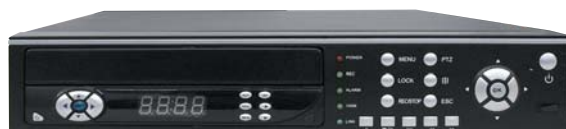
vista frontal pantalla recogida