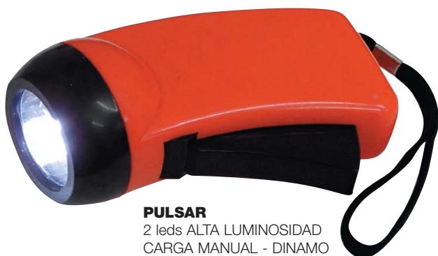
PULSAR 2 leds ALTA LUMINOSIDAD CARGA MANUAL - DINAMO cod. 00740 € 2,40