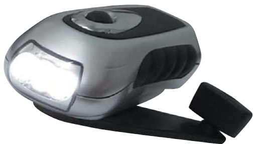
QUASAR 3 leds ALTA LUMINOSIDAD CARGA MANUAL - DINAMO Cargador de móvil / Resistente al agua cod. 00739 € 4,10